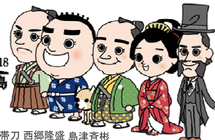
小松帯刀 西郷隆盛 島津斉彬